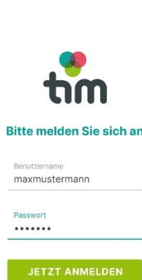
App „tim Graz Lastenrad“ öffnen