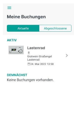
Alle Buchungen in der App sehen